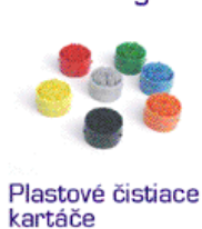
Plastové čistiace kartáče